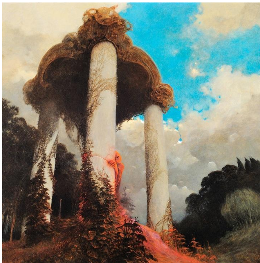
Fot. Zdzisław Beksiński - Bez tytułu ("AC79"), 1979, Muzeum Historyczne w Sanoku