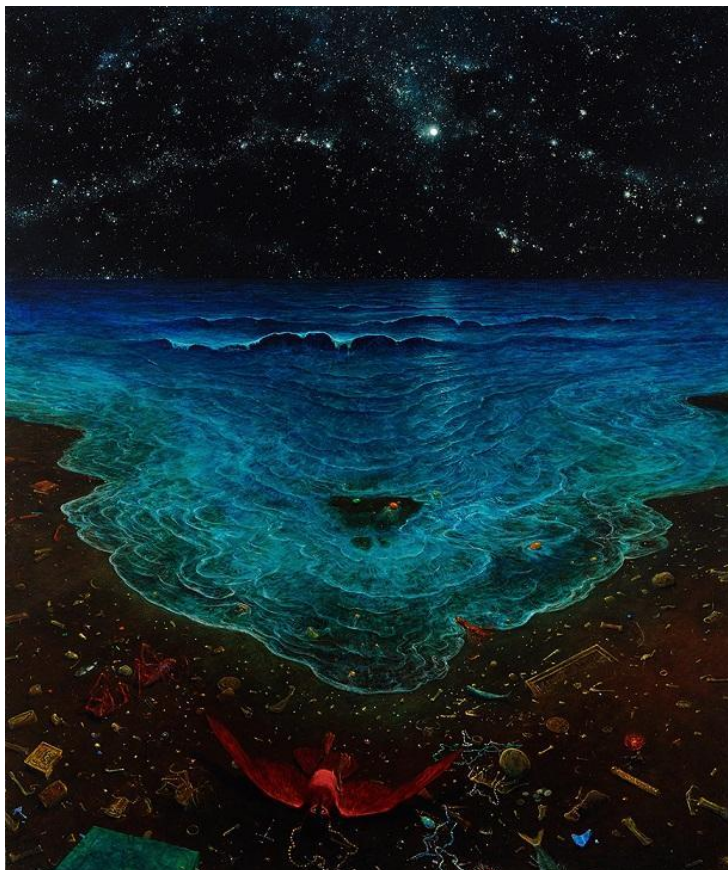
Fot. Zdzisław Beksiński - Bez tytułu ("AG76"), 1976, Muzeum Historyczne w Sanoku

- Już od 18 czerwca serdecznie zapraszamy wszystkich miłośników twórczości Zdzisława Beksińskiego na ten wyjątkowy i największy w historii festiwal jego twórczości. Cieszymy się, że powstał we współpracy z najważniejszymi instytucjami związanymi z artystą, czyli Muzeum Historycznym w Sanoku i Fundacją Beksiński. Jeśli do przekrojowej wystawy malarstwa dodamy wystawę multimedialną, VR, wydarzenia towarzyszące i koncert finałowy, będący ekscytującym połączeniem obrazu i dźwięku, okaże się, że odwiedzający będą mogli poznać twórczość Zdzisława Beksińskiego w pełni - dodaje Anna Będkowska.